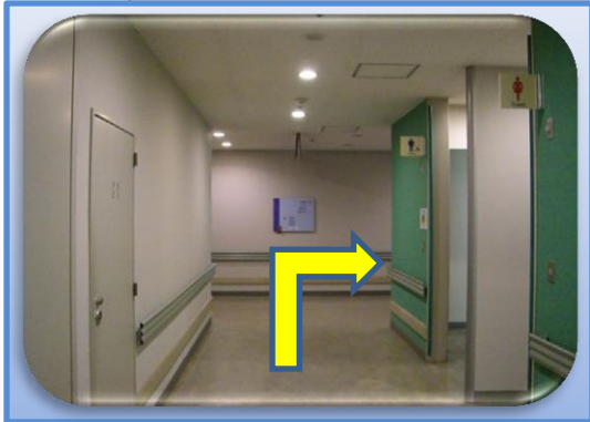
④トイレ前を直進して、放射線診断部 突き当たりを右折