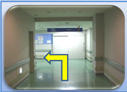
⑤CT8室前を直進して、突き当たりを左折