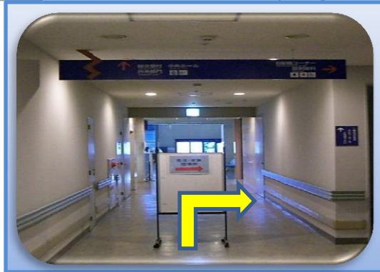
③途中右折して、自販機前廊下へ